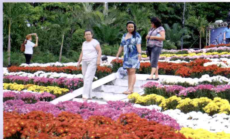
A decoração, que segue os padrões da Praça de Espanha, em Roma, foi um presente dos lojistas para a cidade