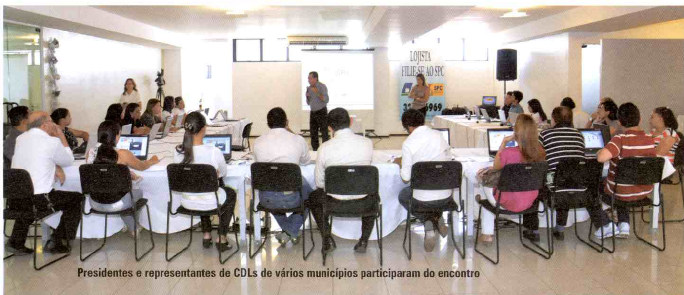
Presidentes e representantes de CDLs de vários municípios participaram do encontro