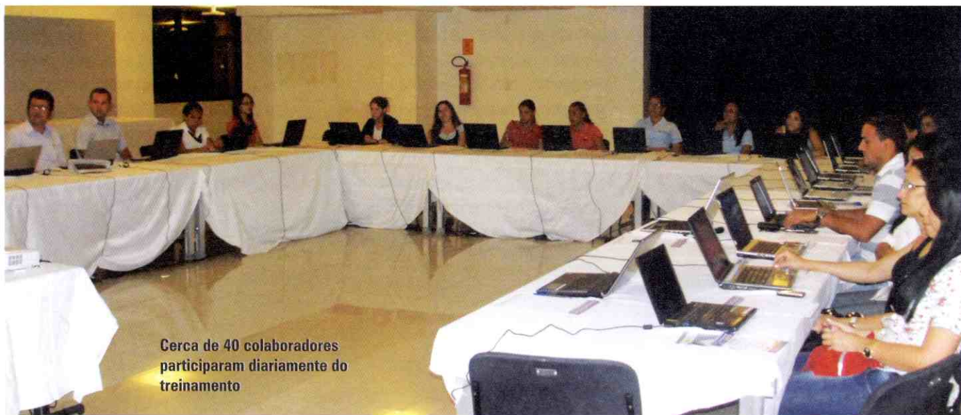
Cerca de 40 colaboradores participaram diariamente do treinamento