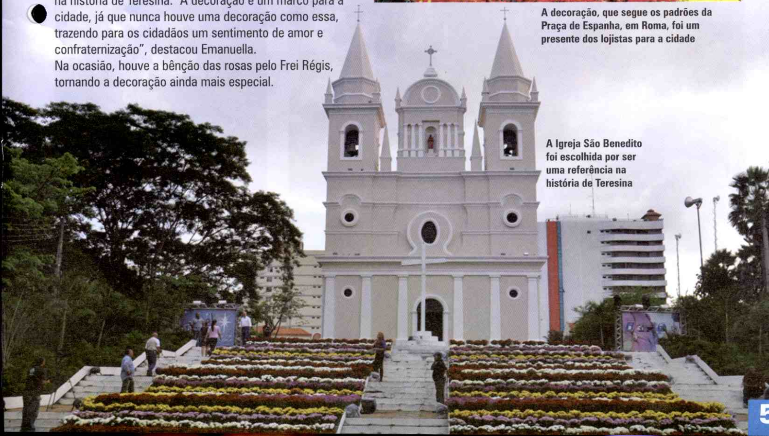
A Igreja São Benedito foi escolhida por ser uma referência na história de Teresina