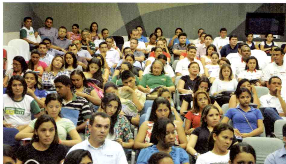
Seminário Estadual SPC 2011 contou com cerca de 300 participantes